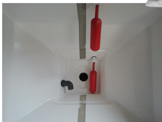
Vue de l'intérieur du bac